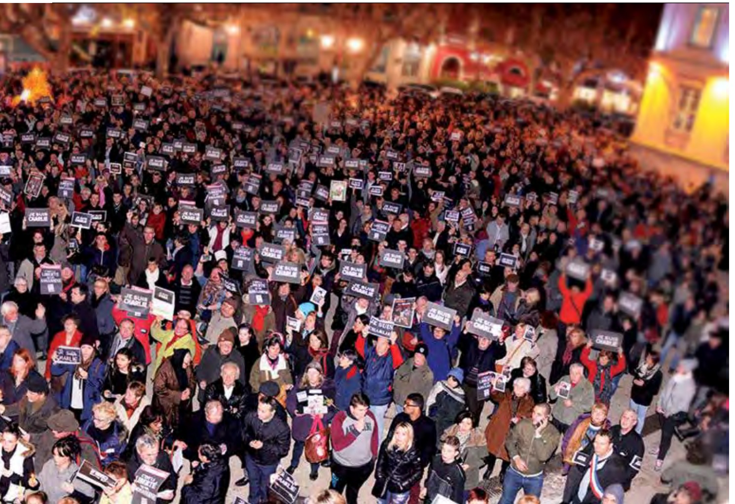
"Je suis Charlie" werd na de aanslag op het kantoor van Charlie Hebdo wereldwijd de slogan als steunbetuiging voor de vrijheid van meningsuiting en vrije pers.