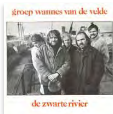
Ze kwamen uit 't zuiden Van Lent / Van De Velde op de CD: de zwarte rivier van Groep Wannes Van De Velde 1990

meerdere nationaliteiten en verblijfplaatsen.