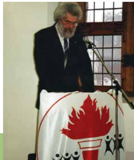
30 jaar Oudervereniging voor de Moraal (1993)

is er altijd een voorbereidingsweekend. Hier werken de leerlingen samen met hun leerkrachten zedenleer een programma uit rond een bepaald thema. Het resultaat brengen ze dan met veel enthousiasme in de schouwburg.