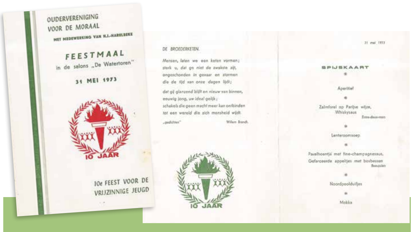
Feestmaal feest voor de vrijzinnige jeugd 1973

veel gezaaid heeft op in het begin schrale (gelovige) grond. De resultaten voor de vrijzinnige gemeenschap in het Kortrijkse zijn echter immens. Het werk is echter nooit af, waakzaamheid zal altijd nodig zijn. Na 50 jaar is onze vereniging nog altijd alert en ondersteunen wij nog altijd waar nodig.