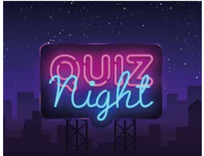
Activiteiten uit de regio // Vrijzinnig Kortrijk

Meer informatie volgt in de volgende editie van zoeklicht.'